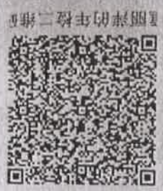
童丽萍的年检二维码

本证书经检验合格，继续有效一年， This certificate is valid for another year after this renewal.