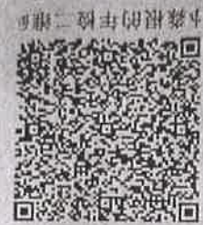
本蔡根的年检二维码

本证书经检验合格，继续有效一年。 This certificate is valid for another year after this renewal.