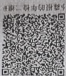
孙森根的年检二维码

本证书经检验合格，继续有效一年。 This certificate is valid for another year after this renewal.